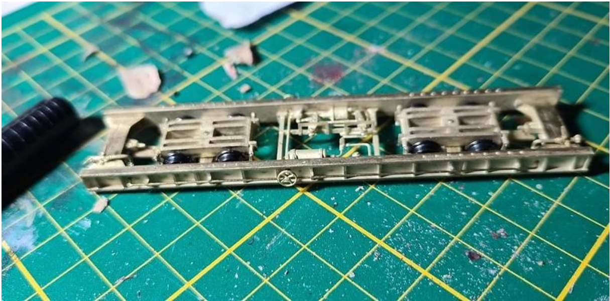
Een artikel over mijn Coferna diesellok in 0e verscheen in het clubblad van de 7mm Narrow Gauge Association, Narrow Lines.