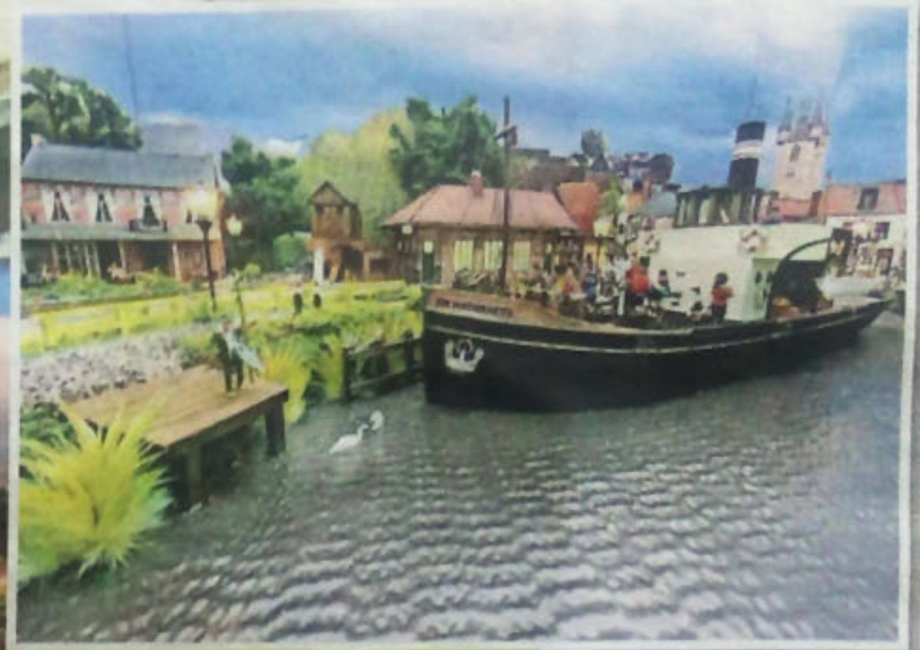
◀ Sinterklaas komt aan in miniatuur Sluis.