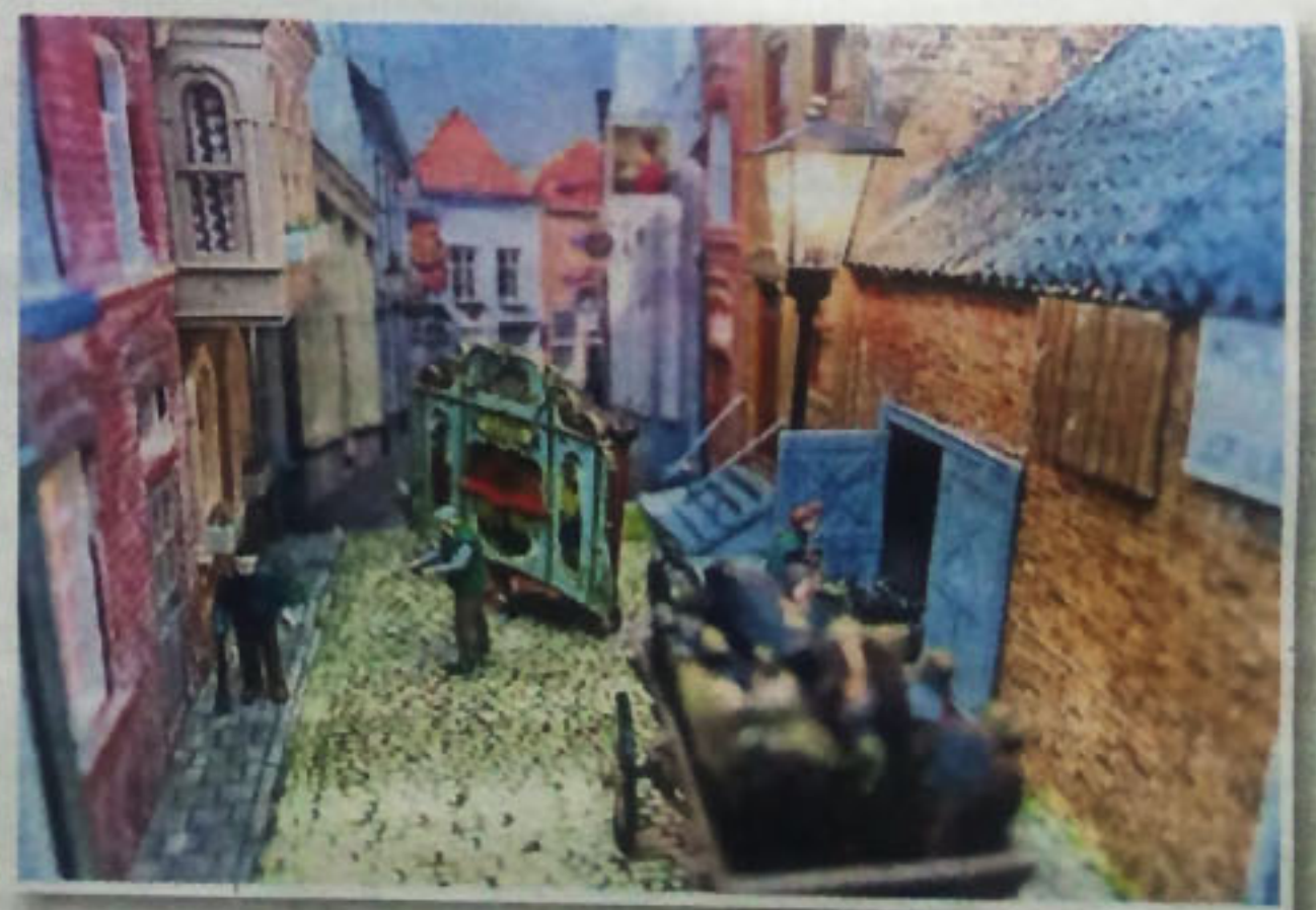
◀ Zelfs de draaiorgelman ontbreekt niet in de gedetailleerd uitgevoerde straatjes.