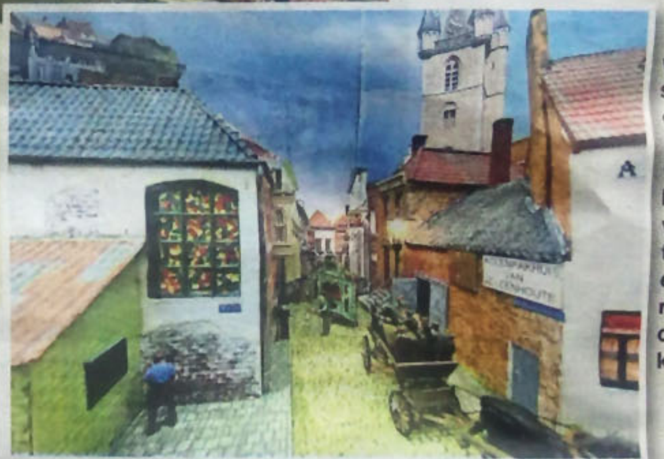
◀ Een wildplasser, draaiorgel, paard en wagen: kleine verhaaltjes zijn er genoeg te ontdekken.